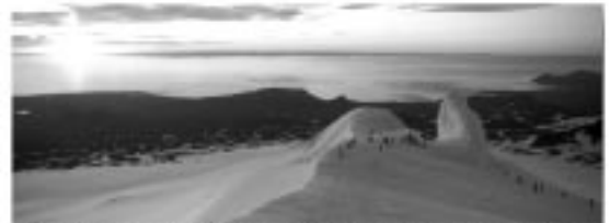
tekin í nærtungu á Jökulinn s.l. sunn.

Ganga á Snæfellsjökul um sumarsólstöður föstudaginn 20. júní kl. 21.