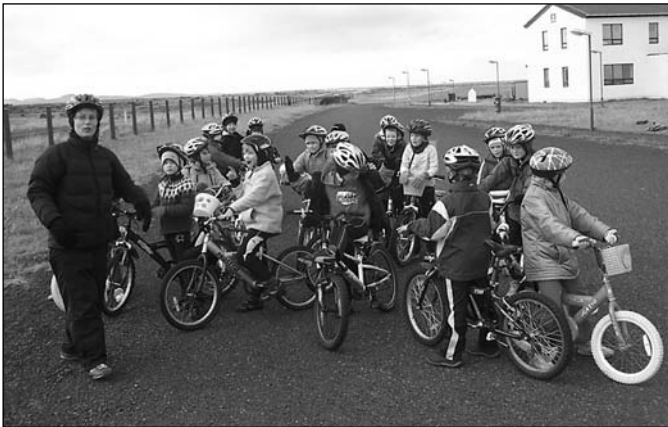
Krakkarnir með umsjónarkennara við heimkeyrsluna á Gufuskálum

Síðastliðinn miðvikudag, 20. september fór 2. bekkur í Grunnskóla Snæfellsbæjar, í hjólaferð. Hjólað var ásamt umsjónarkennara bekkjarins í lögreglufylgd frá skólanum á Hellissandi að Gufuskálum. Á Gufuskálum var farið í leiki og hjólað þar um göturnar og snætt nestið í laut í hrauninu. Þetta var mjög skemmtilegur dagur og athyglisvert var að flest barnanna nýttu hjálmana