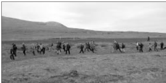
Gögnuhópurinn í upphafi ferðar við hinn forna Saxhól.

daga yndislegt samfélag bæði á andlegu og landfræðilegu ferðalagi. Vegna góðrar þátttöku, verður stefnt að því að endurtaka gönguna að ári og vonandi sjá sem flestir sér fært að taka þátt í henni á næstu Jónsmessu.