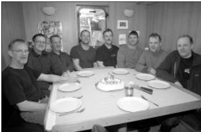
Áhöfnin á Steinunni gæddi sér á köku í tilefni af 500 tonnnum

Hrygningarstoppið hófst þann 1. apríl s.l. og því eru flestir aðkomubátarnir farnir til sinna heimahafna. Aflabrögð í nýliðnum marsmánuði voru mjög góð og kanski ekki von á öðru þar sem að Breiðafjörðurinn virðist vera fullur af æti fyrir þorskinn og raunar aðrar tegundir líka, fréttir hafa borist af því stórar lóðningar af síld og loðnu sjáist á dýptarmælum skipa í Breiðafirði. Þessu aukna æti fylgir aukin fiskgengd og má sem dæmi nefna að áberandi er hve mikið er farið að veiðast af karfa í dragnót.